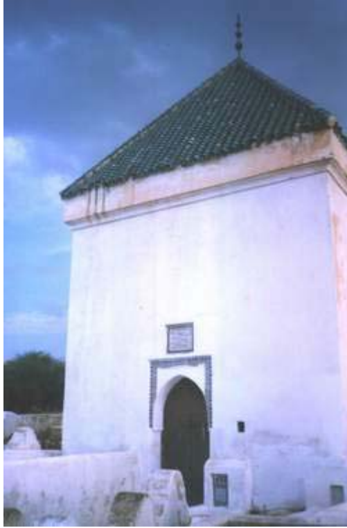
Kubur asy-Syaikh 'Abdul 'Aziz ad-Dabbāgh di Fez